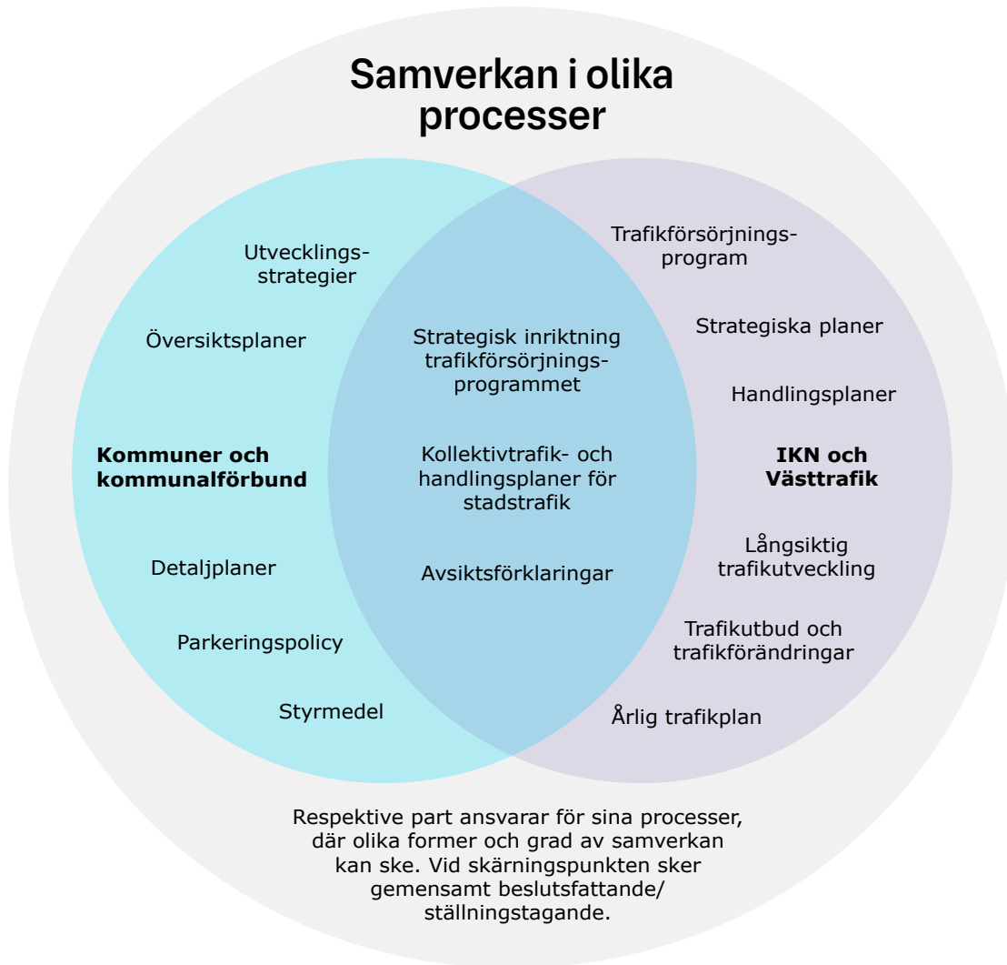
Figur 1: Samverkan i olika processer. Respektive part ansvarar för sina processer, där olika former av samverkan kan ske. Vid skärningspunkten sker gemensamt beslutsfattande/ ställningstagande.

För kollektivtrafiken ställer sig parterna gemensamt bakom trafikförsörjningsprogrammets strategiska inriktning. Den strategiska inriktningen lägger grunden för innehållet i trafikförsörjningsprogrammet, vilket styr hur Västtrafik kan verkställa trafik. På lokal nivå kan parterna besluta om handlingsplaner och avsiktsförklaringar för att kraftsamla kring utvecklingen inom ett specifikt geografiskt område.