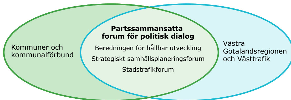
Figur 3: Parternas forum för politisk dialog om kollektivtrafik.

Som forum för politisk dialog om kollektivtrafikutvecklingen i Västra Götaland finns beredningen för hållbar utveckling (BHU) och fyra delregionala strategiska samhällsplaneringsforum. För de fem regionala kärnorna; Borås, GMP (Göteborg/Mölndal/Partille), Uddevalla, Trollhättan/ Vänernsberg respektive Skövde sker fördjupad samverkan inom respektive stadstrafikforum.