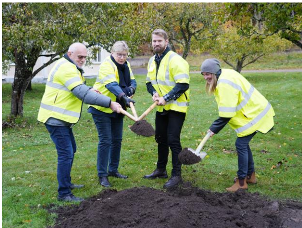
Första spadtaget tas för att förädla Nohaga trädgård.

Playa Mjörn är en del i utvecklingen av den exploatering som sker på Mjörnstranden. Framtagande av idéer och genomförande av dessa som exempelvis strandpromenad, bänkar, solstolar med mera, kommer att vara pågående projekt under perioden.