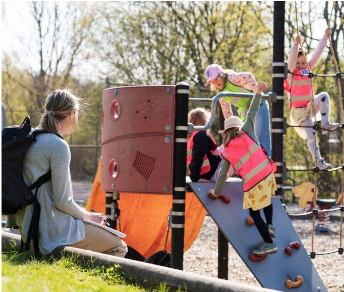
Vid planering av lekplatser samlas önskemål från de som ska använda lekplatsen in.

När det gäller lekplatser arbetar förvaltningen med en femårsplanering som stöds av lekplatsplanen. Lekplatserna ska locka både alingsåsare och besökare utifrån och vara attraktiva, pedagogiska och ha ett stort lekvärde.