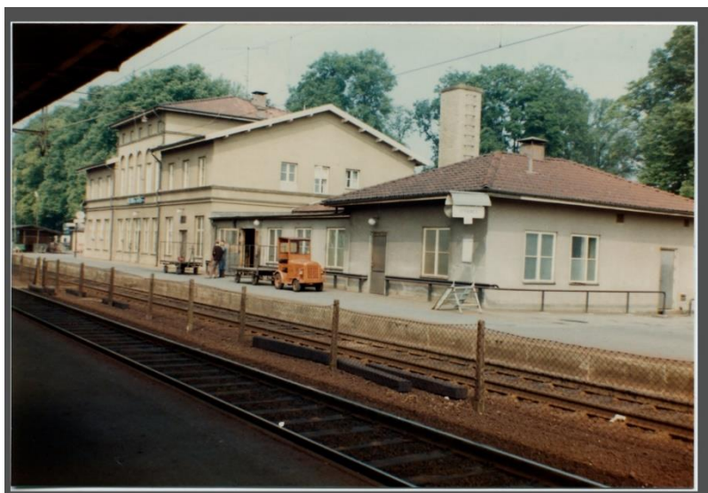
Figur 2: Original foto på Alingsås Centralstation

Vi ska renovera fasad och fönster på centralstationen och under projektering har vi fått indikationer på att färgen på centralstationen inte är original så vårt förslag är att göra miljöhuset i den kulör som centralstationen en gång varit, se figur 2.