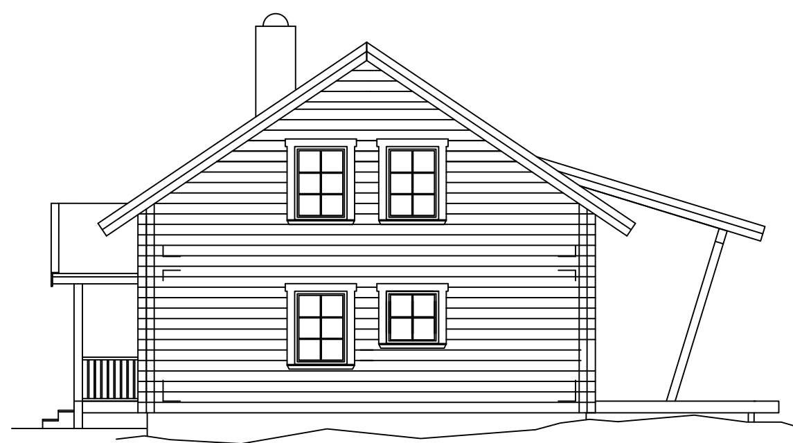
FASAD MOT ÖST