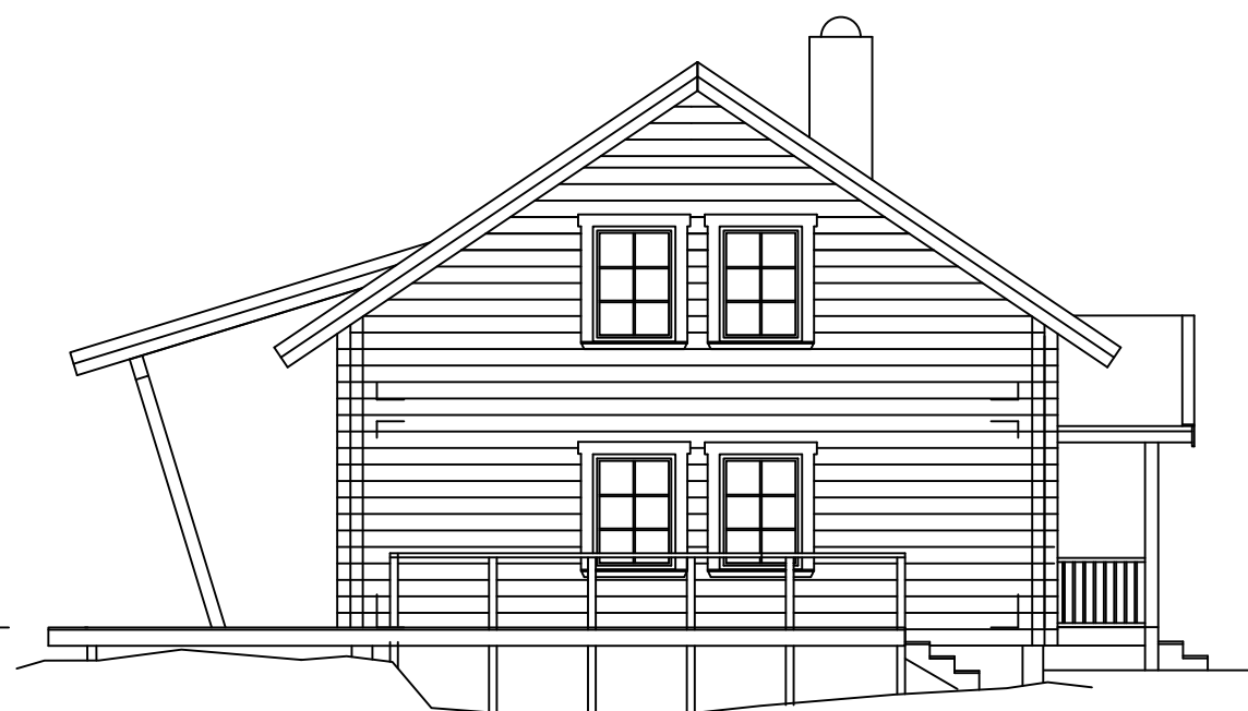
FASAD MOT VÄST