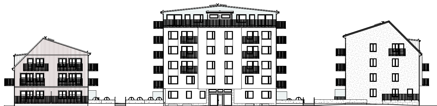
ÖVERSIKT, GATUFASAD MOT VÄSTER