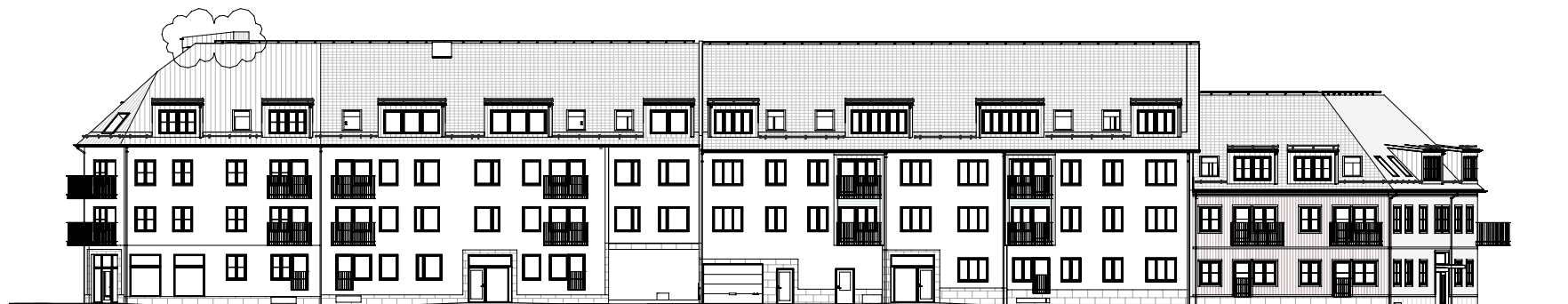
ÖVERSIKT, GATUFASAD MOT ÖSTER BL