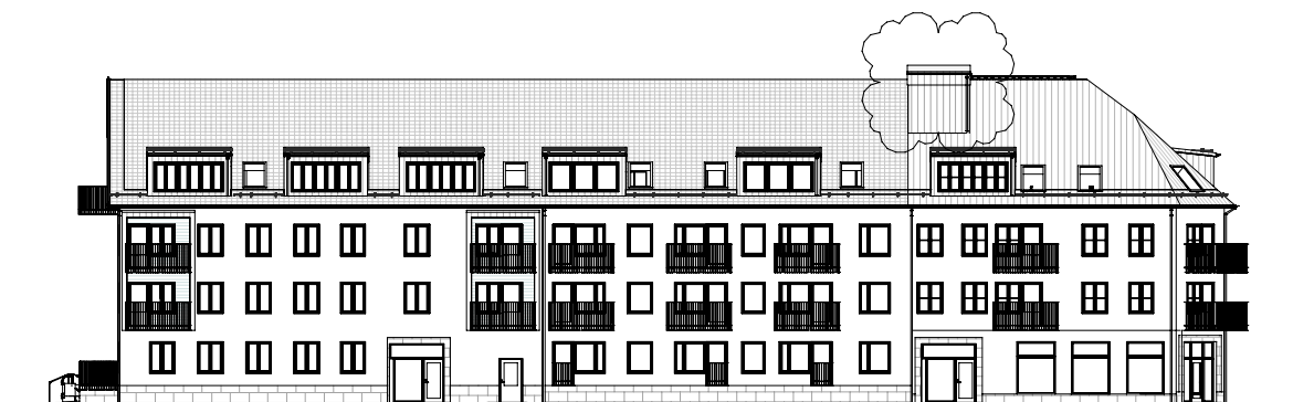
ÖVERSIKT, GATUFASAD MOT SÖDER BL