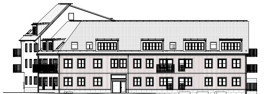
ÖVERSIKT, GATUFASAD MOT NORR BL