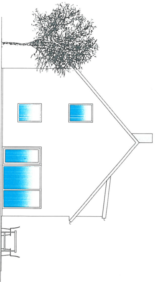
Fasad mot norr