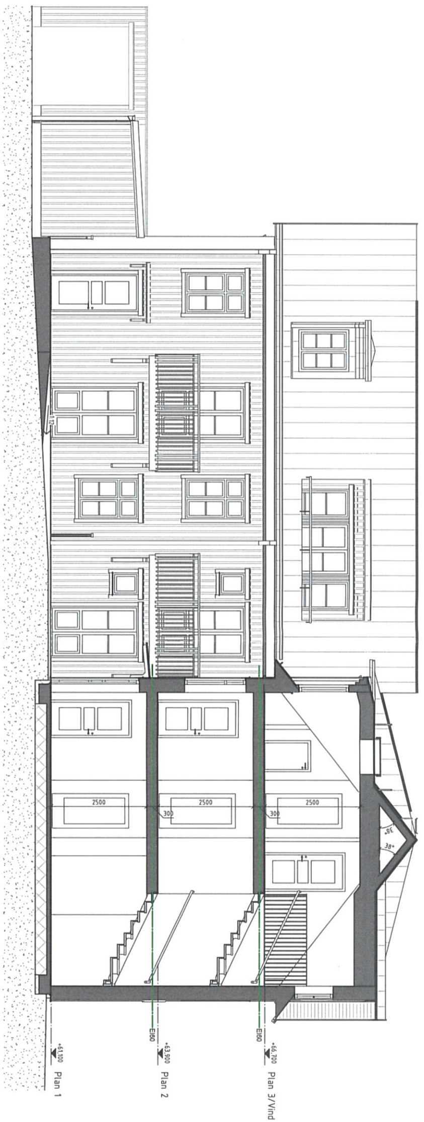
GÅRDSFASAD MOT VÄSTER OCH SEKTION A1 (SEKTIONEN SKÄR I TRAPPANS GÅNGLINJE)

HÄNVISNINGAR PLACERING PÅ TOHTEN ENLIGT HÄRKRITNINGAR SE ÄVEN RITNING A-1-0-1-010.