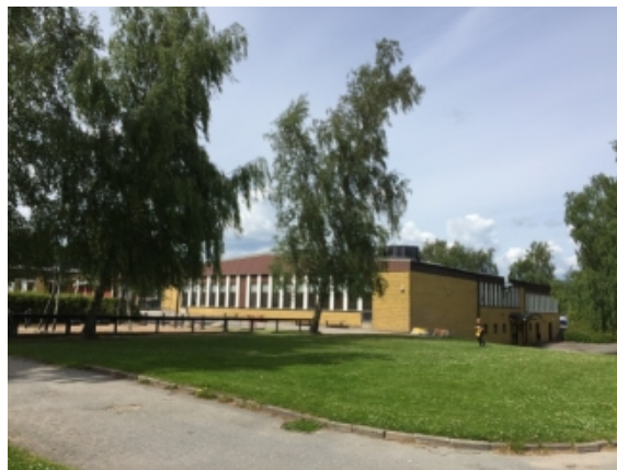
Foto från planområdet

Möjliggöra för en ändamålsenlig trafik- och parkeringslösning samt säkra allmänhetens tillgänglighet till Mjörn genom ett grönstråk.