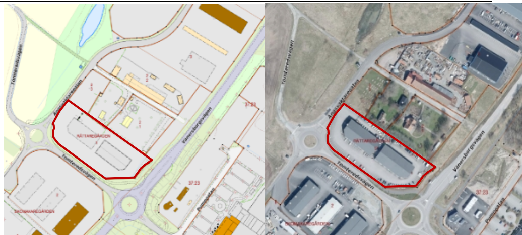
Karta - Röd markering visar fastigheten

Samhällsbyggnadskontoret förslår avslag för sökt åtgärd.