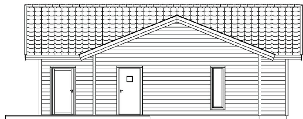
Fasad mot Öster