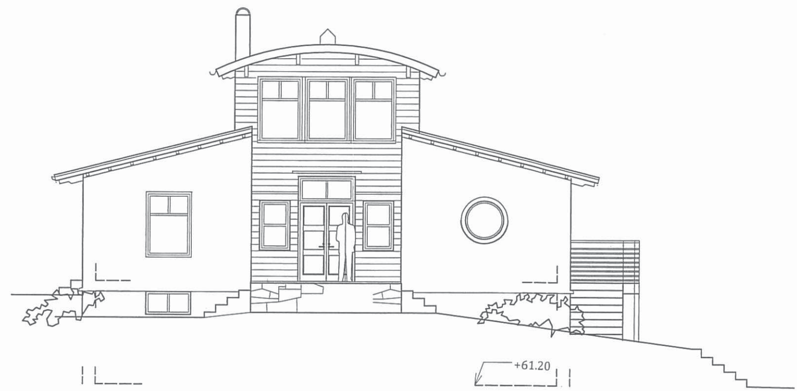
FASAD MOT SYDOST