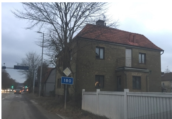
Foto från Vänersborgsvägen