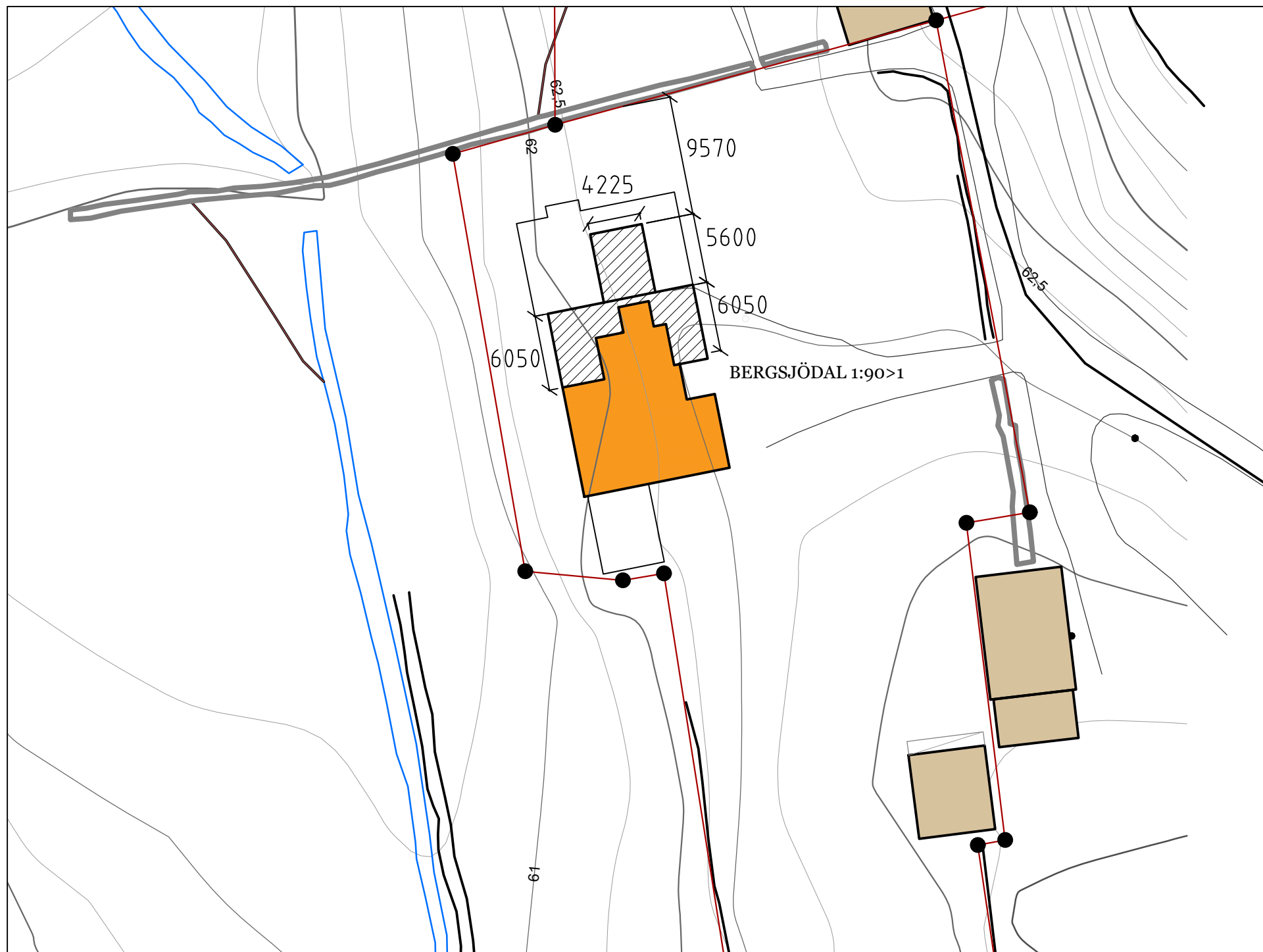
SITUATIONSPLAN FASTIGHETS BETECKNING: BERGSJÖDAL 1:90 ALINGSÅS KOMMUN