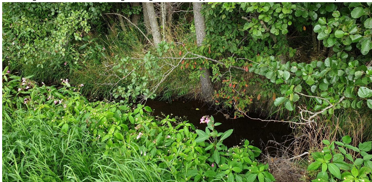
Jättebalsamin utmed bäcken norr om väg 1956 på aktuellt vägavsnitt.

Som tidigare framförts är det högst troligt att denna typ av arter kan komma att vandra in på vallen.