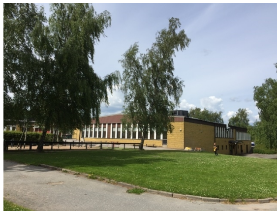
Foto från planområdet

Möjliggöra för en ändamålsenlig trafik- och parkeringslösning samt säkra allmänhetens tillgänglighet till Mjörn genom ett grönstråk.