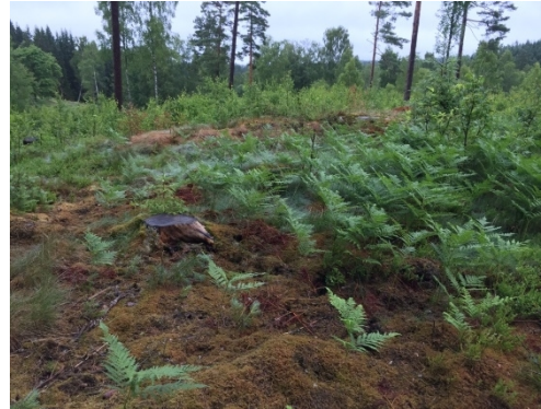
Utsikt mot nordöst över byggnadsplatsen