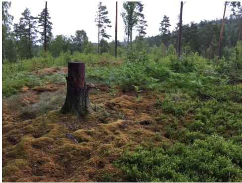
Utsikt mot öst över byggnadsplatsen

Förprovning Uppdrag Program Samråd Granskning Antagande Förhandsbesked Bygglov Lantmäteri Avtal Överlåtelse Projektering ordningsställande av allmän plats