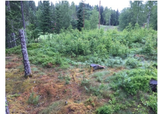
Utsikt mot norr över byggnadsplatsen