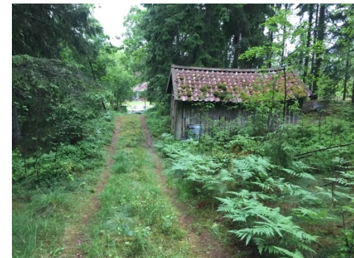
Tänkt utfartsväg, vy mott norr.