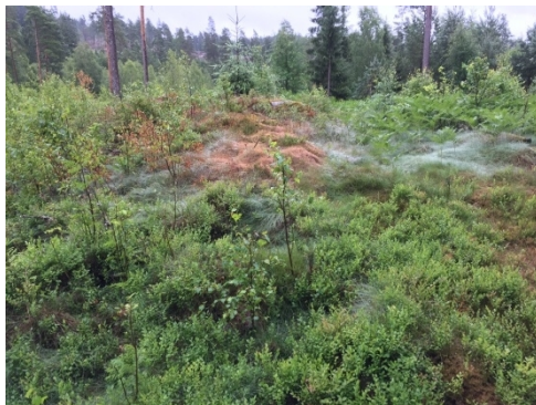
Utsikt mot nordöst över byggnadsplatsen