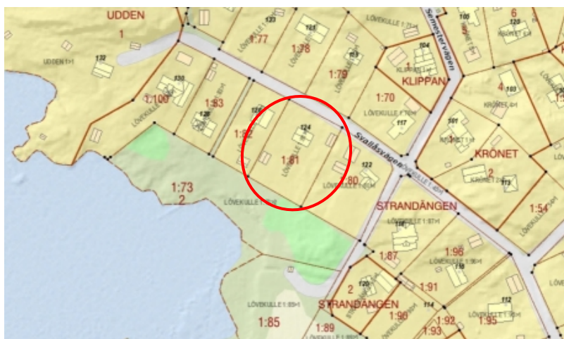
Foto från Svallåsvägen