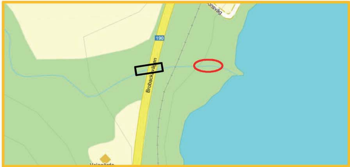
Figur 2: Skala 1:50. Svart markering visar byte av trumma. Röd markering visar kompensationsåtgärd för förbättrad vattengång i vattendrag.