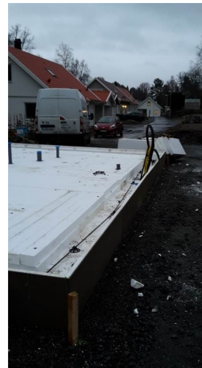
Foto från tillsynsbesöket