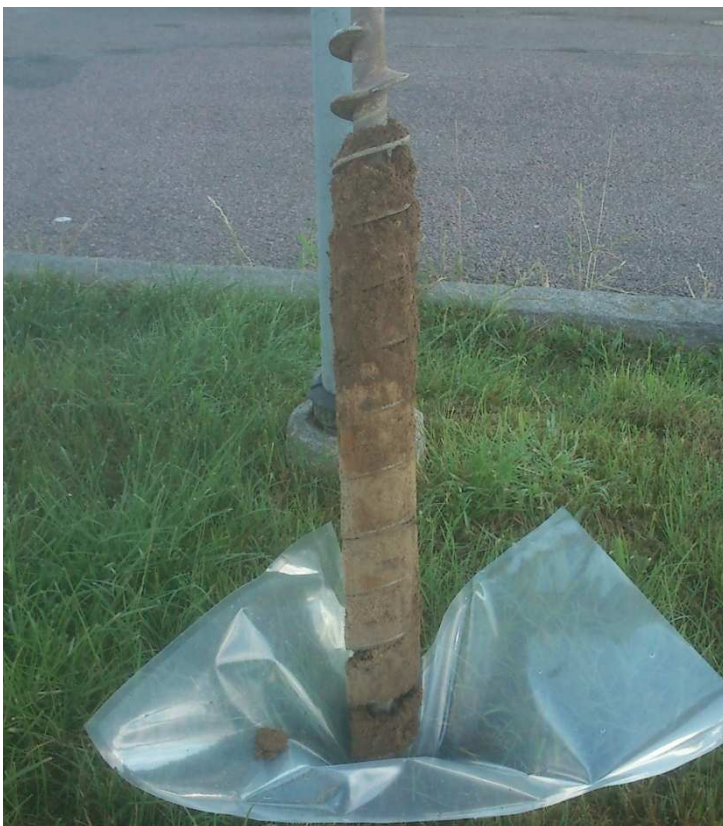
Bild 2. Sandlager, 0,4-0,8 m, under mulljorden (ej i bild) i provpunkten 1401

Ingen lukt av olja noterades från jordlagren i någon provpunkt. PID-mätningar på jordprover gav inte någon indikation på förekomst av flyktiga föroreningar i marklagren.