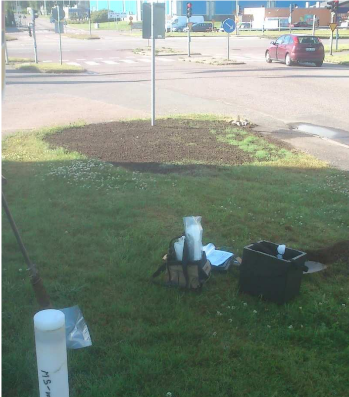
Bild 1. Nysådd yta efter sanering: i förgrunden provtagning i 1401 samt grundvattenrör från miljöteknisk markundersökning inom Ladan 1:1 (se ovan).

Fältobservationer indikerar att de ytliga jordlagren inom området utgörs av ca 0,3-0,4 mäktigt lager mulljord med inslag av grus och sand. I provpunkten 1403 (söder om elcentralen) påträffades ett förhållandevis stort inslag av tegel, betongkross och asfalt, men i övriga punkter noterades inget betydande inslag av antropogent material.