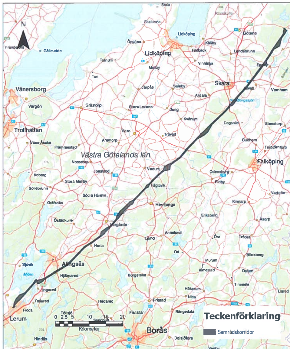
Översiktskarta över planerad ledningsförnyelse mellan Timmersdala och Stenkullen.