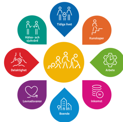
En god och jämlik hälsa – åtta målområden

Den kommunala nivån har stor rådhighet och stort ansvar inom de flesta av de åtta målområden för den nationella folkhälsopolitiken. Därigenom finns möjligheter att både direkt och indirekt påverka hälsan och hälsans fördelning i befolkningen.