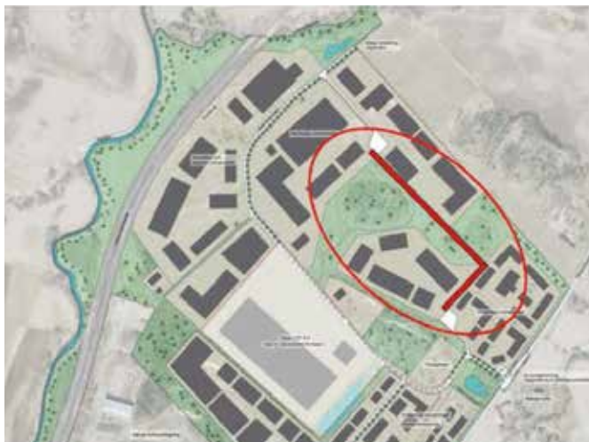
Figur 2: Visar förslag på vägnät som möjliggör rundkörning.

Räddningstjänsten lyfter även att det planerade vägnätet inte möjliggör för rundkörning, vilket skulle vara mycket fördelaktigt om det gjorde det i händelse av olycka. Förslagsvis utökas vägnätet enligt nedan som möjliggör rundkörning, se figur 2.