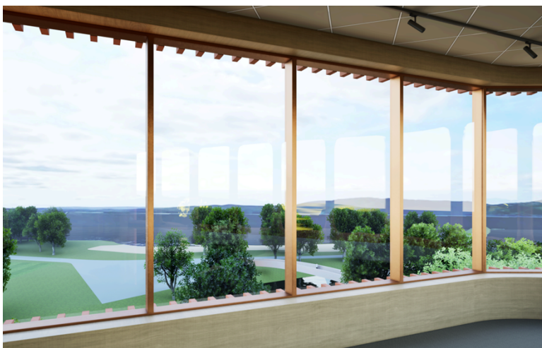
Figur 5 Utsikt från konferensanläggningen.