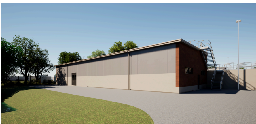
Figur 2 Fasadmaterial enligt alternativ 2.