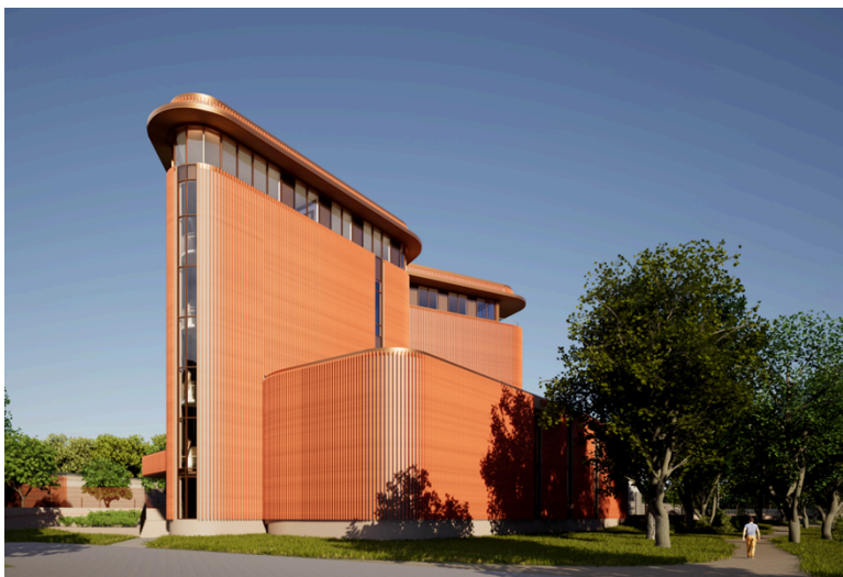
Figur 4 Byggnad för lagring av slam med konferensanläggning i översta planet.

Nya Nolhaga reningsverk kommer att ha en 20 m hög byggnad för lagring av det slam som avskiljs vid reningen av avloppsvattnet. Den höga höjden behövs för att uppnå vissa tekniska funktioner vid hanteringen av slammet. Byggnaden kommer att vara belägen vid fastighetens yttre kant, i nära anslutning till Hälsans stig och bron över Sävåns utlopp till Mjörn. Förvaltningen ser en möjlighet att ovanpå denna byggnad bygga en konferensanläggning som skulle kunna vara tillgänglig för alla Alingsås kommuns förvaltningar och politiker. Ingång till konferensanläggningen skulle i så fall vara från utsidan av Nolhaga reningsverk. Byggnaden erbjuder en unik möjlighet att konferera med en fantastisk utsikt över de vackra omgivningarna i Nolhaga, med sjön Mjörn i fokus. Se illustration av byggnaden i Figur 4, Figur 5 och Figur 6 nedan.