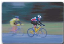
Potential Vårgårda 2006 - 2015