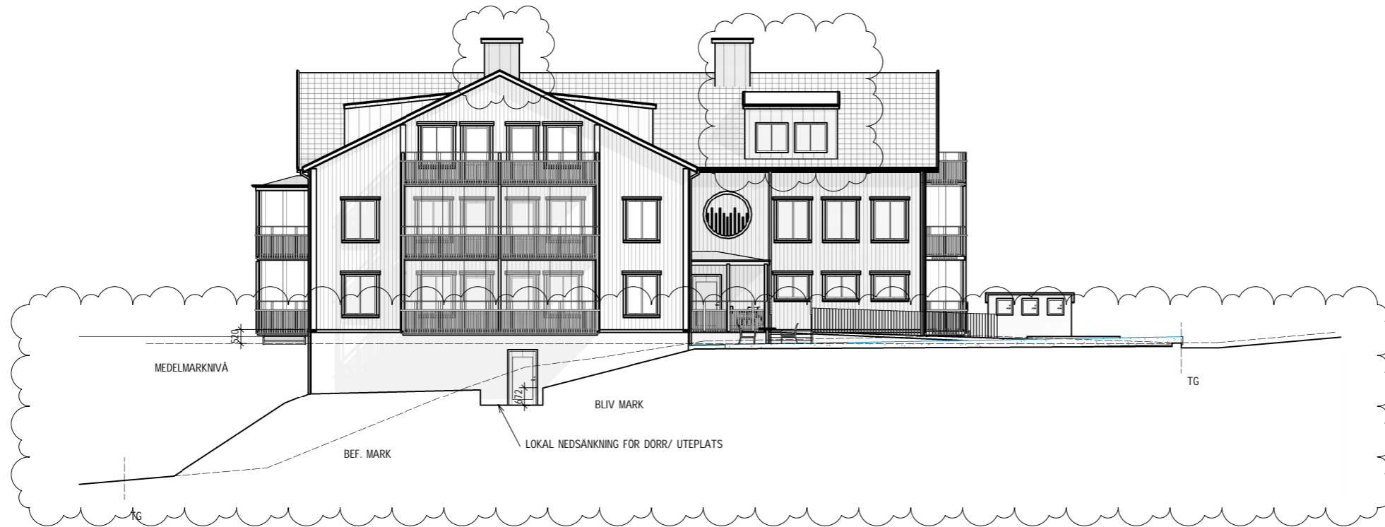
Fasad mot Väster