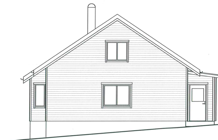
FASAD MOT SYDOST