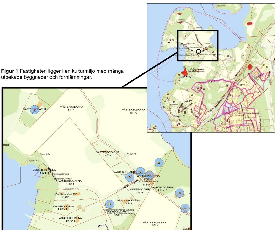
Figur 1 Fastigheten ligger i en kulturmiljö med många utpekade byggnader och fornlämnningar.

1. stads- och landskapsbilden, natur- och kulturvärdena på platsen och intresset av en god helhetsverkan,