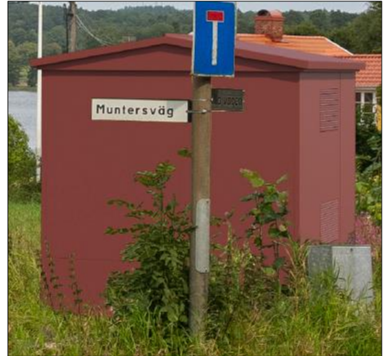
Figur 5-6 Byggnaden ovan visar en nätstation/transformatorstation som i sin mer detaljerade utformning är bättre anpassad inom och intill kulturmiljöer.