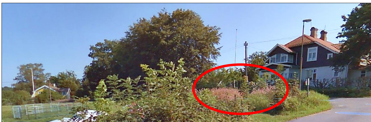
Figur 3 På andra sidan vägen ligger en kulturhistoriskt utpekad byggnad och den röda markeringen ringar in ungefärlig plats för nätstationen. Foto ur kommunens GIS-kartas Street View – funktion.

Fotomontaget i figur 2 visar en röd, mindre byggnad, där färgvalet kanske avser att smälta bättre in i kulturmiljön och landskapet. Äldre bodar och ekonomibyggnader såg dock väsentligen annorlunda ut. Taket på en sådan byggnad hade antingen pulpettak eller brantare