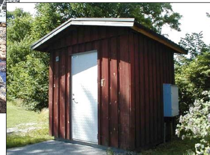
Figur 7-8 Dessa foton visar hur stor betydelse som utformningen av nätstationer/transformatorstationer har för och i kulturmiljöer. Fotot är taget i en annan kommun.