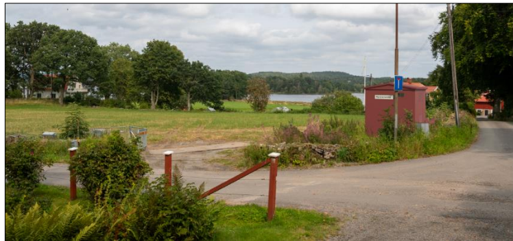
Figur 2 Fotomontage med avsedd placering av nätstationen. Fotomontage ur ärendet.

En modern nätstation som placeras högexponerad i det öppna landskapet skulle påverka utblicken mot kulturhistorisk bebyggelse mot norr och öster, likaså mot en av de kulturhistoriskt utpekade sommarvillorna, som ligger på andra sidan vägen från anvisad placering (figur 2-3). Det utgör ett väsentligt främmande element i detta landskap.