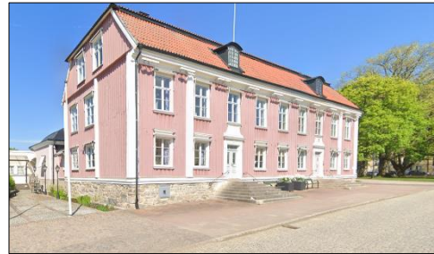
Figur 1 Den välkända framsidan av Rådhuset Kristina 7 vid Stora Torget.