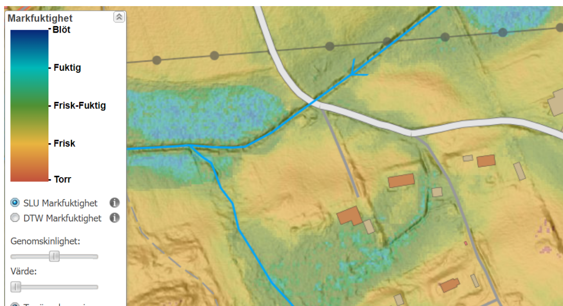
Bild 4. Karta över markfuktighet (enligt SLUs modell). Fastigheter del av Maryd 2:23 och Maryd 2:28.

https://kartor.skogsstyrelsen.se/kartor/?startapp=skador&x=7140041.9537&y=721383.4952&scale=24982.690656000006&bg=Markfuktighet