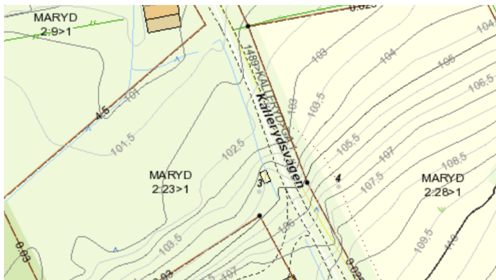
Bild 1. Karta med höjdkurvor över fastigheterna del av Maryd 2:23 och Maryd 2:28.