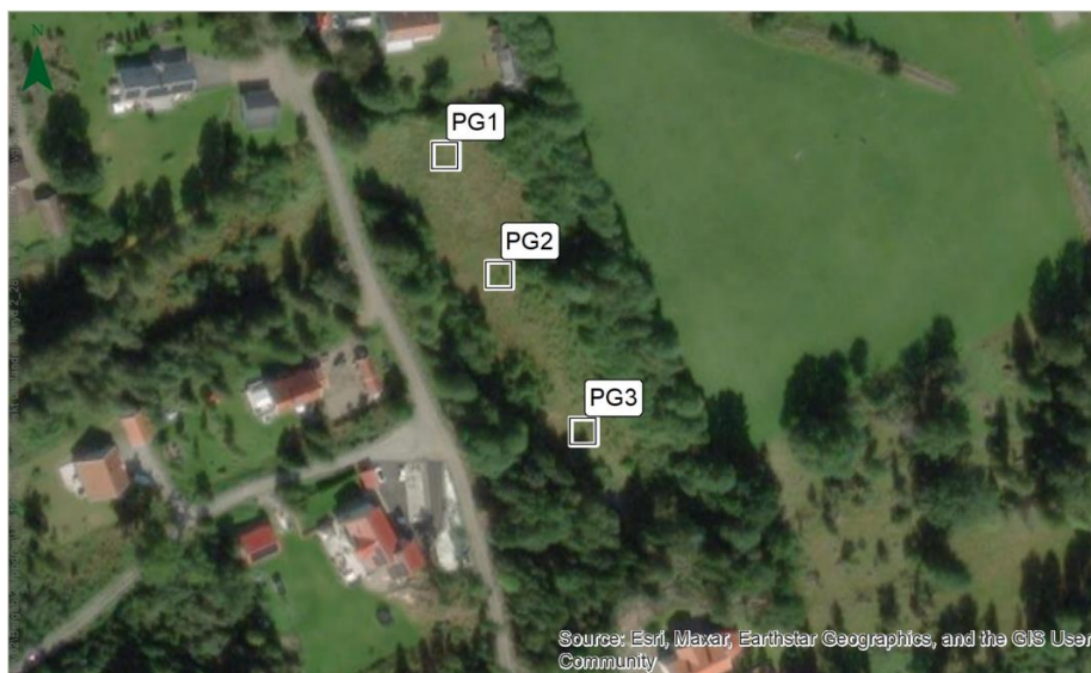
Bild 2. Karta med provgropar (PG 1, PG 2, PG 3) över fastigheterna del av Maryd 2:23 och Maryd 2:28.

Från PM Hydrologisk utredning Maryd 2:28, Bergab (2023)